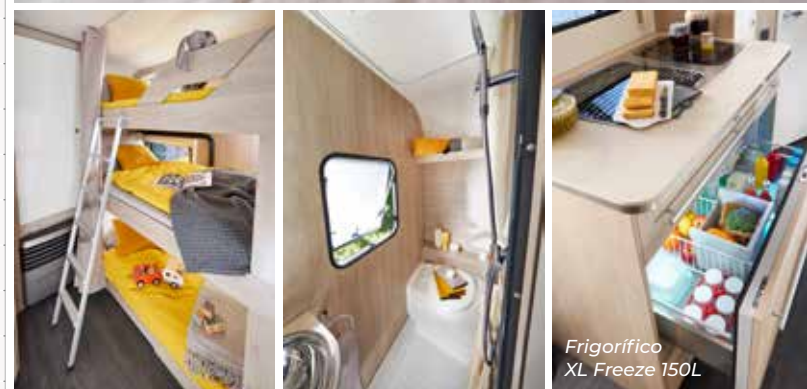
Frigorífico XL Freeze 150L