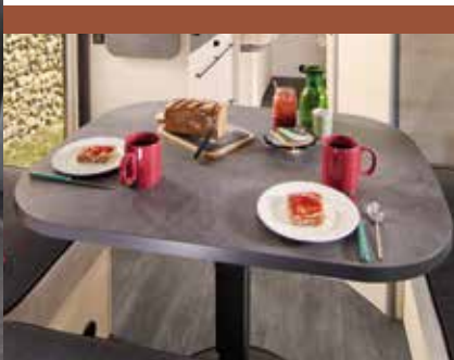
Bordoverflate Exclusive Line