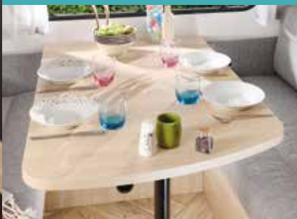
Bordoverflate Sport Line